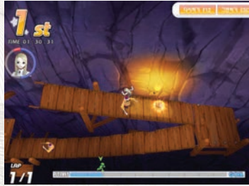
점프 / Jump