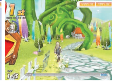
달리기 / Running