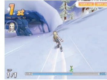
스키 / Ski