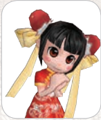
밍밍 Ming Ming