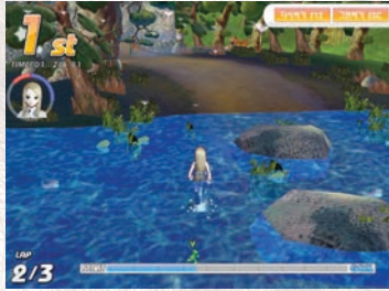
수영 / Swimming