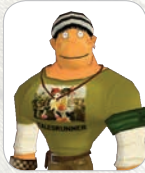
빅보 Big Bo